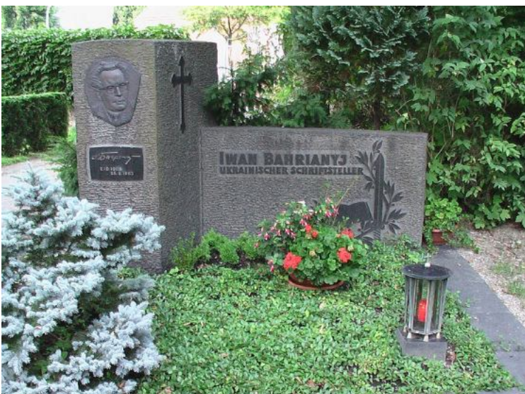
Могила І. Багряного в м. Новий Ульм (Німеччина)

Помер Іван Багрянний 25 серпня 1963 року і похований в Новому Ульмі.